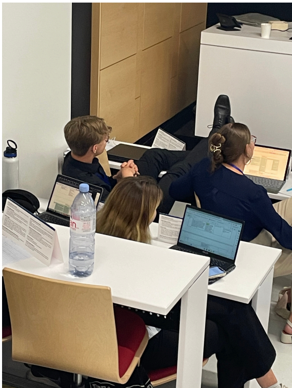
ID en commission TRAN... un peu trop à l'aise