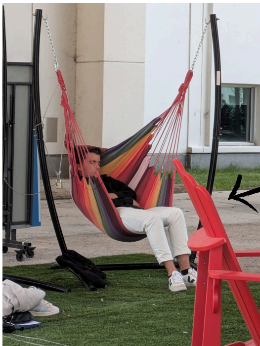
Le député Alexandre Badlo de Renew s'est accordé une sieste après une journée éprouvante